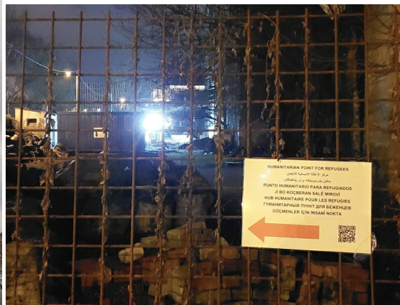
Humanitarna stanica kod Paromlina, Zagreb, decembar 2022 / januar 2023.

Iako se, za razliku od fizičkih prepreka uz državne granice koje su medijski relativno dobro pokrivena, ali uglavnom ne i kompleksnije prikazana, o ogradama unutar teritorija, onima koje jesu a osobito onima koje nisu dio prostora službeno namijenjenih iregulariziranim migrantima, manje piše i govori, one su, kako se može naslutiti i iz ovdje navedenih primjera, itekako prisutne i djelotvorne. O njima također govori i lik dječaka iz Zamora materijala koji se na nekoj od migracijskih ruta po Evropi, nakon što je uspio prijeći ogradu oko detencijskog centra te na bodljikavoj žici ostavio deku s otisnutim inventarnim brojem, pokušava domoći neimenovanoga grada na sjeveru: Ograda. Svuda ograde; Još nikad nije vidio toliko ograde; Europa, to su koridori, nadvožnjaci, skladišta – a prije svega ograde (Šindelka 2019: 8; 10; 28). Mnoge od tih ograde, treba dodati, nisu postavljene specifično za ljude u pokretu, ali tek u iskustvu skrivenih iregulariziranih kretanja postaju stvarne prepreke, poput nadvožnjaka ili autoceste koju je potrebno skriveno i opasno prijeći kako bi se, primjerice, nastavio put šumom . U tom smislu – dakle zaprečivanja ili otežavanja kretanja nepoželjnima – ograde u unutrašnjosti teritorija ne razlikuju se od ograde i drugih prepreka na državnim i drugim vanjskim, evropskounijskim ili šengenskim granicama,