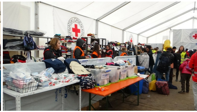
Kamp u Slavonskom Brodu, ograde u distribucijskom šatoru. Lijevo: uoči dolaska vlaka. Desno: ograda u vrijeme tranzita, između volontera i ljudi u pokretu. 1. 3. 2016.