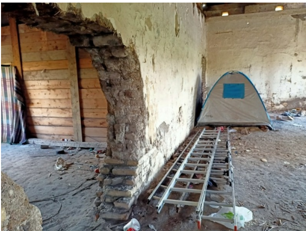
Horgoš, 2021. godina.

Merdevine, kao alatku za prelazak granice, odnosno kao deo opreme za gejm , opazila sam prilikom posete u kampu u Somboru 2021. godine, poslagane na jednoj gomili. Njima se trguje. Ljudi obeleženi kao „krijumčari“ (mogu biti i samo radnici koji pokušavaju da plate sopstveni put), prodaju svojim saputnicima merdevine po nekoliko puta većoj ceni u odnosu na cene u zvaničnim prodavnicama, i postavljaju ih na ograde. Merdevine korišćene za gejmn na srpsko-mađarskoj granici su vatrogasne merdevine na izvlačenje. Izgled tih merdevina se može videti na fotografiji koju je u jednom skvotu slikala nevladina organizacija Klikaktiv: