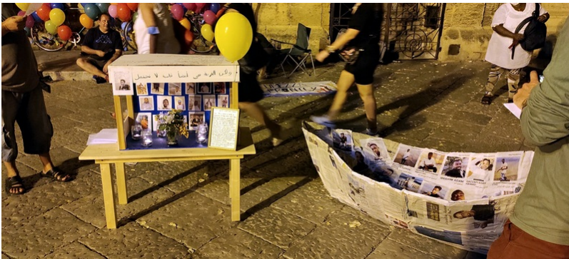
Komemoracija za umrle na Sredozemlju, Palermo, 17. 9. 2021.